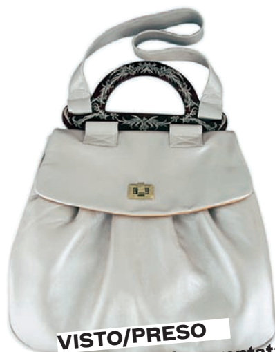
VISTO/PRESO Borsa in pelle argentata “Luca” by Chie Mihara - 410 euro www.chiemihara.com